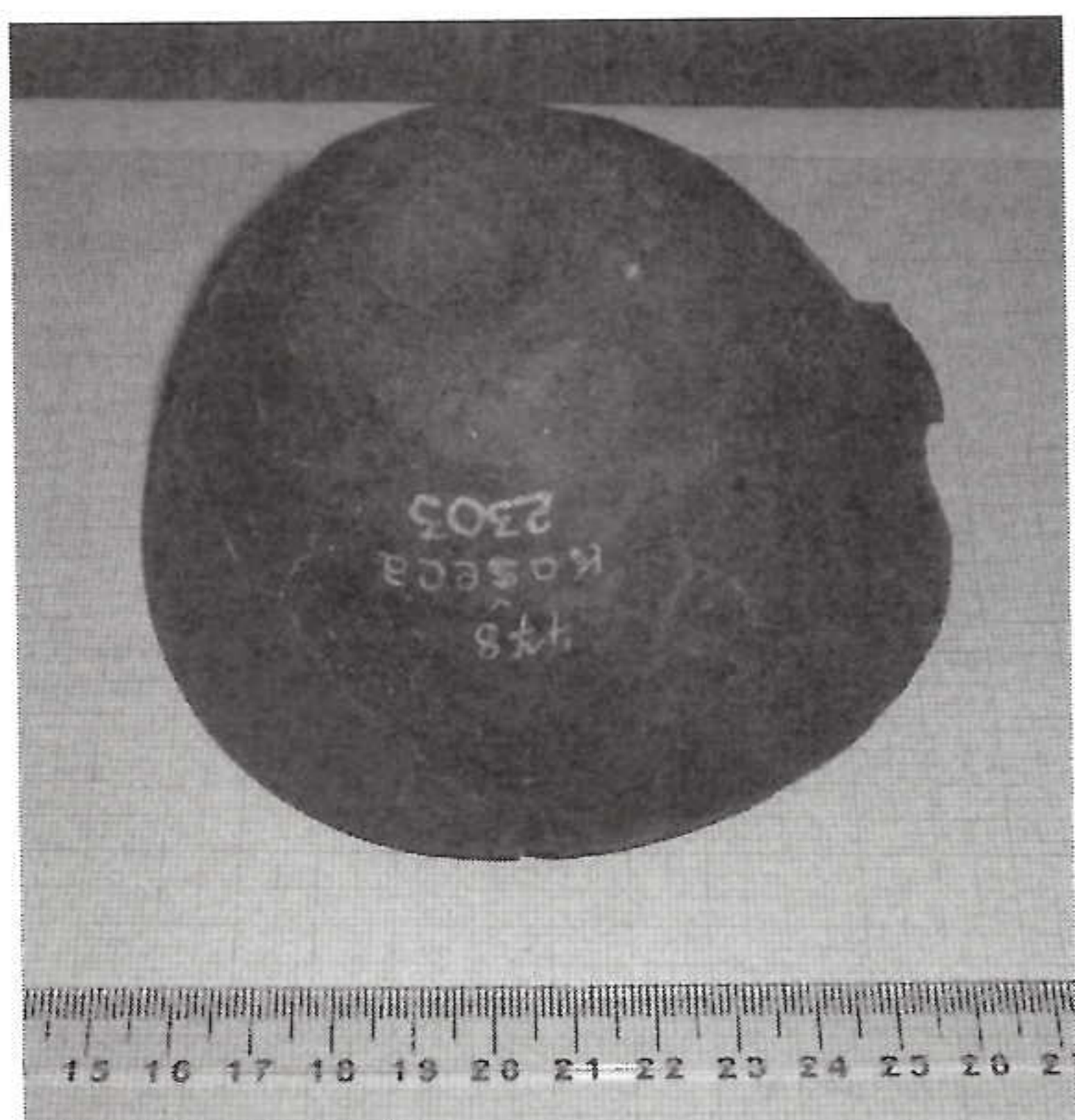
2) šálka keramická, ev.č. A2303, lokalita: Košeca, pohrebisko lužickej kultúry (čl. I ods. 1, písm. b) zmluvy)